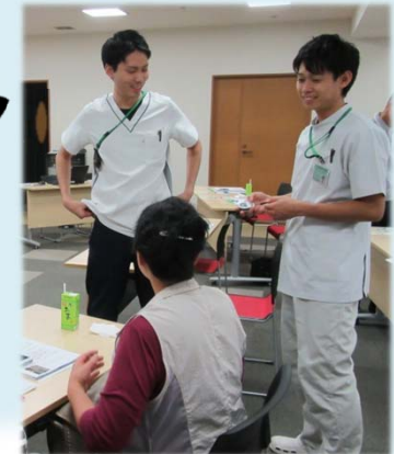
疑問・質問 大歓迎です！