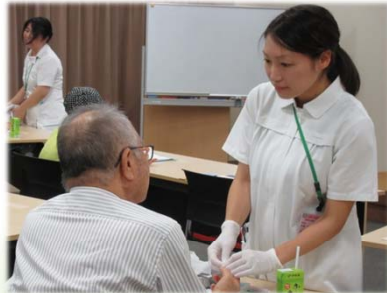
お気軽にご相談ください