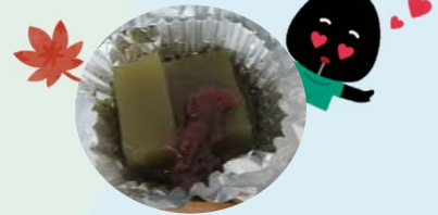
今回はおいしい健康から簡単に作れる低カロリー抹茶寒天のレシピのご提案があり、皆で試食しました！