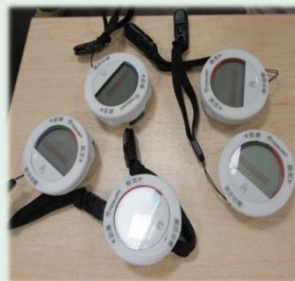
手のひらサイズの歩数計