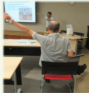
手と足を反対に開いて…意外と難しい運動です