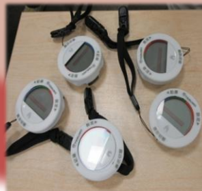
手のひらサイズの歩数計