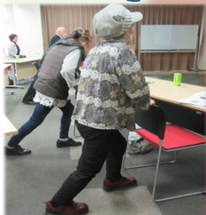
歩くためにも足の運動を取り入れましょう！