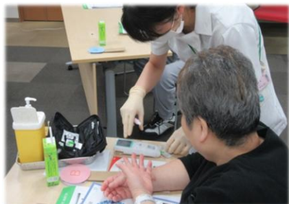
検査数値がすぐにわかります