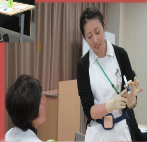
わからないところは質問をどうぞ！